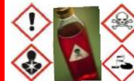
Déchets dangereux pour la santé