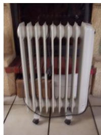
Radiateur à bain d'huile