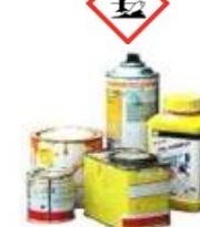
Récipients souillés de produits dangereux