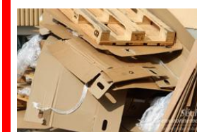
Bois, carton, plastique mêlé avec ferrailles/métaux

Cette liste n'est pas exhaustive, en cas de doute, demander l'avis au Responsable d'Exploitation ou à l'accueil.