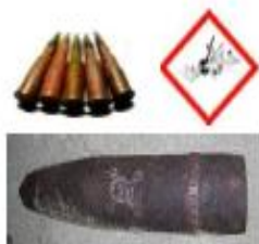
Déchets militaires Munitions