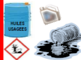
Matières de vidange Déchets hydrocarbonés