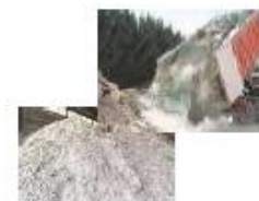
Déchets pulvérulents ou gravats