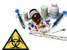
Déchets hospitaliers, de soins, infectieux