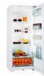
Gros Electroménager Froid