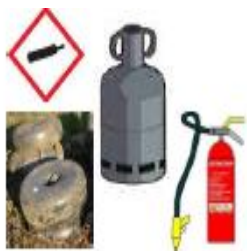
Déchets explosifs Bouteilles de gaz, GPL, extincteurs