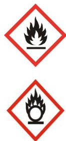
Déchets inflammables Combustibles ou non refroidis