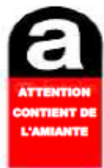
Déchets contenant de l'amiante